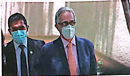
SUCRE. El Alto Comisionado de la ONU a su llegada al Tribunal Constitucional.