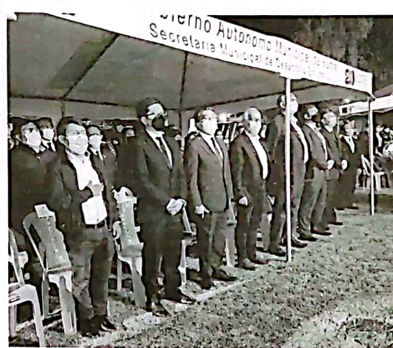
LANZAMIENTO. La ceremonia contó con la presencia de autoridades departamentales, municipales además de invitados especiales.

“Tenemos resultados de la gestión 2019, cuando participaron alrededor de 280 expositores y se tuvo más de 5 millones de movimiento económico; entonces, nuestra intención es por lo menos alcanzar esas cifras, tomando en cuenta que la situación es compleja; tenemos empresas que aún están en condiciones bastante adversas, pero sin lugar a dudas vamos a hacer todo lo posible para alcanzar la meta”, manifestó el presidente de la Fundación Fexpo Sucre